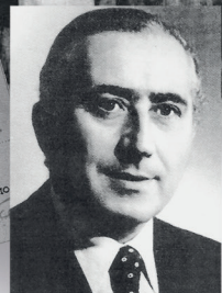
Sen. Giovanni Marcora