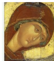
Tavola consigliata: cm 21x28 liscia