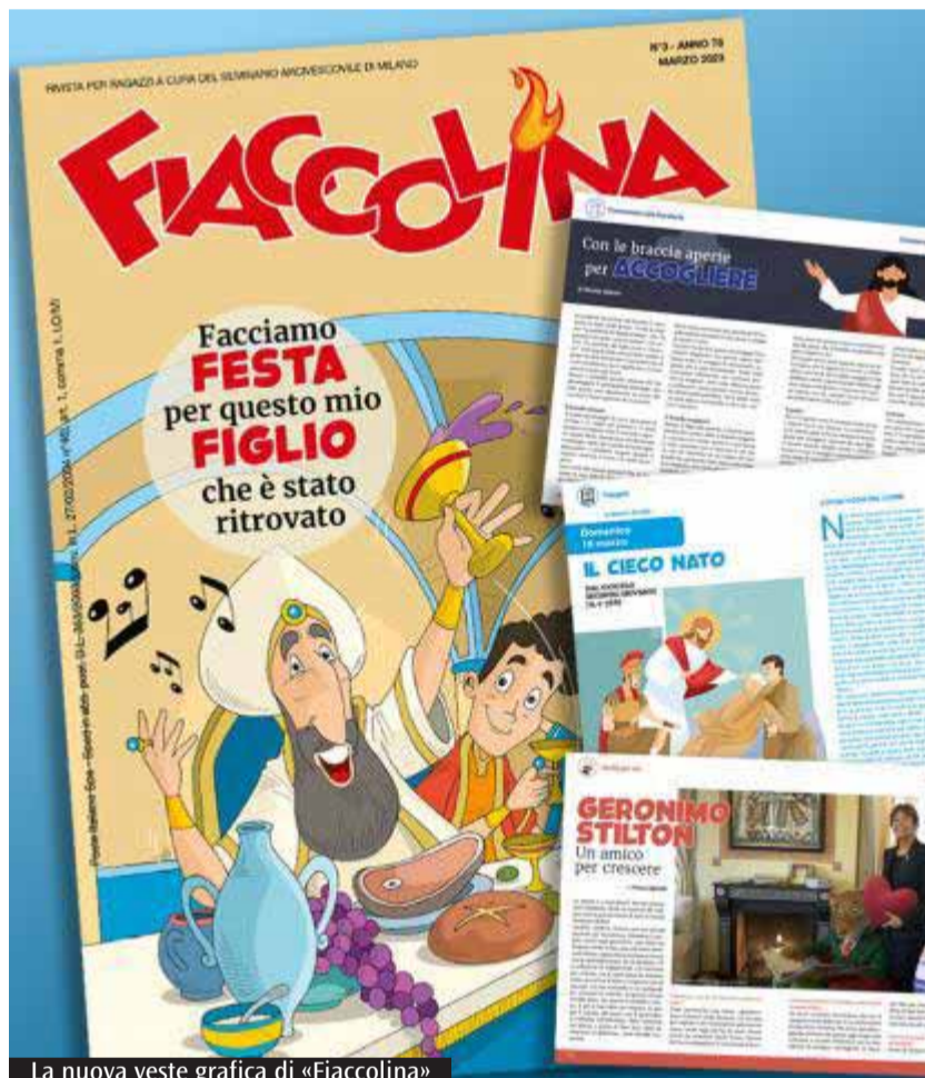
La nuova veste grafica di «Fiaccolina»

La rubrica «Santo del mese» è dedicata ad una figura significativa della Chiesa, a partire da un suo motto o frase celebre, mentre nella storica sezione «Eccoci qui» sono pubblicate le foto dei vari gruppi chierichetti della Diocesi che, di volta in volta, si presentano. Le pagine finali della rivista sono le più ludiche, con tanti giochi, dagli enigmi, ai cruciverba ai rebus, che seguono sempre il tema del mese. Per ricevere Fiaccolina contattare l'ufficio del Segretario per il Seminario, tel. 02.8556278; segretario@seminario.milano.it.