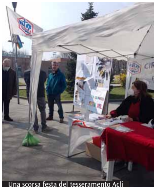
Una scorsa festa del tesseramento Acli

Saranno 100 le piazze di Milano e provincia e della Brianza, che nel fine settimana del 18 e 19 marzo si coloreranno con le bandiere delle Acli. Come già l'anno scorso quando si è deciso riprendere il tradizionale appuntamento con la Festa del tesseramento, saranno allestiti banchetti dove sarà possibile, non solo aderire alle Acli, ma scoprire il variegato mondo dell'associazione, che quest'anno compie 78 anni.