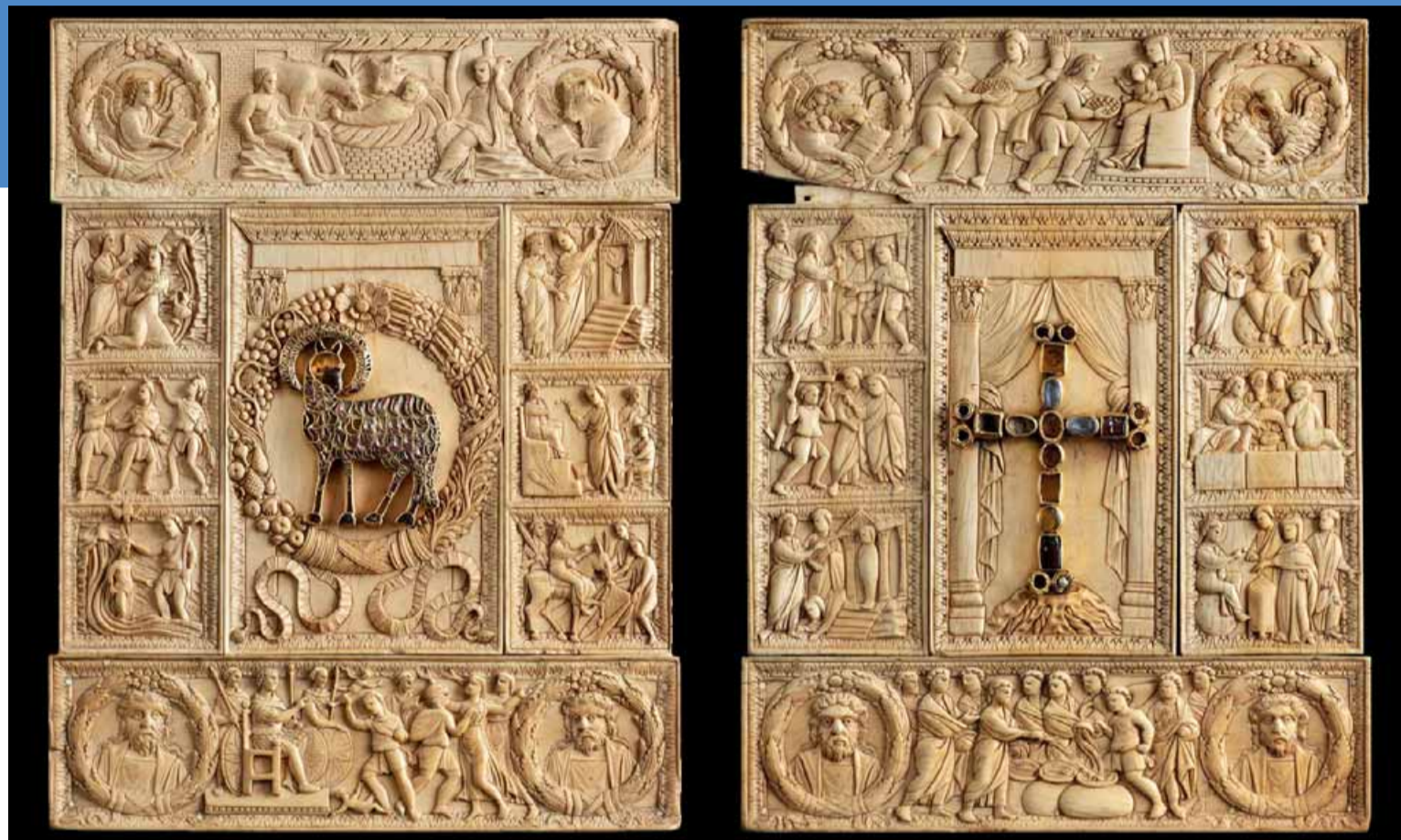
La copertina di evangelario detta «Dittico delle cinque parti» (fine del V secolo), Tesoro del Duomo di Milano

più essere rimandata. Manicheismi a parte, il film riesce grazie a un grande cast femminile a renderci partecipi di dilemmi a cui tutti - e non solo le donne - dovrebbero dedicare tempo ed emozioni. C'è un grande pacifismo che incornicia il dibattito delle protagoniste e una grande fiducia nell'insegnamento come capacità di spezzare le catene della violenza. Quando il film arriva a questo punto, ci si accorge di quanto l'audiovisivo parli di violenza e molto meno della cultura della violenza. Non mancano sequenze emozionanti, in un film che sembra fatto per l'ottobre, ma forse andrebbe dibattuto nelle scuole tutti gli altri giorni. Temi: violenza sulle donne, oppressione, fuga, diritti, religione, società patriarcale, insegnamento, cultura.