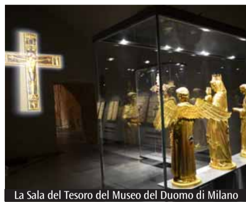
La Sala del Tesoro del Museo del Duomo di Milano

E altri elementi ancora restano da indagare. Come il reale significato dell'inserimento, in un certo contesto, di alcune scene (ad esempio l'«Obolo della vedova», dove ci si aspetterebbe le «Pie donne al sepolcro»...). O una più precisa datazione dell'avorio, che sarà offerta dall'analisi al carbonio 14, ancora in corso. Ma l'aspetto forse più commovente e più emozionante di questo capolavoro, è proprio nell'usura di alcune sue parti: bordi, cornici, volti dove per secoli e secoli si sono posate mani e labbra devote, a venerare la Parola vivente.