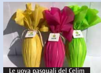
Le uova pasquali del Celim

Anche quest'anno il Celim (Centro laici italiani per le missioni) ha «fatto l'uovo». Un uovo di 280 grammi in cioccolato fondente o al latte. Le materie prime utilizzate provengono da prodotti equo solidali. Le sorprese sono realizzate con materiali di riciclo nel rispetto dei principi dell'economia circolare.