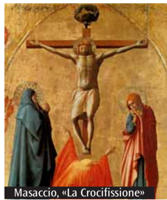
Masaccio, «La Crocifissione»