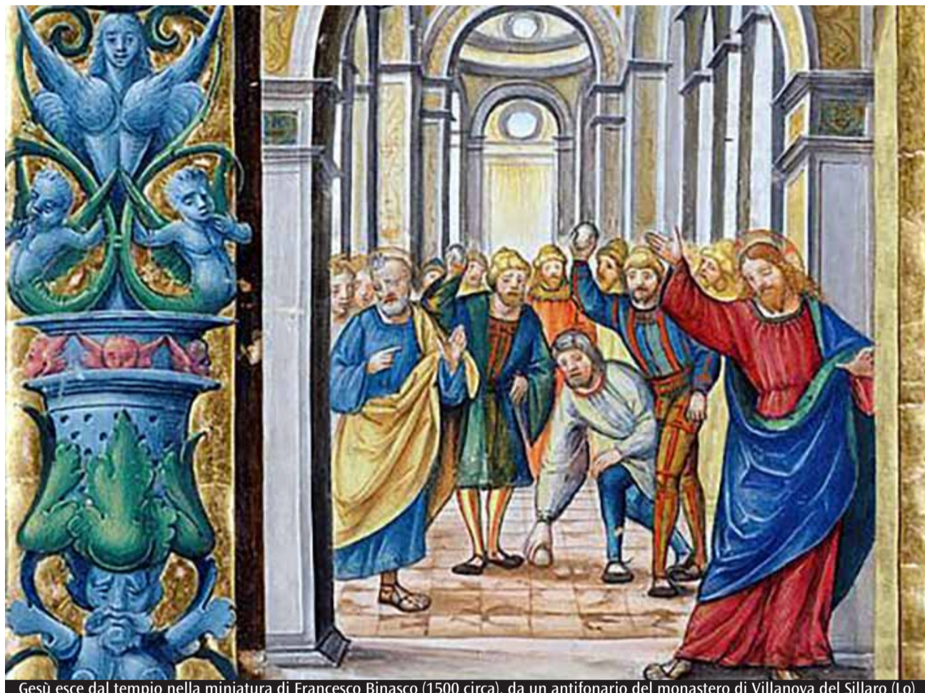
Gesù esce dal tempio nella miniatura di Francesco Binasco (1500 circa), da un antifonario del monastero di Villanova del Sillaro (Lo)