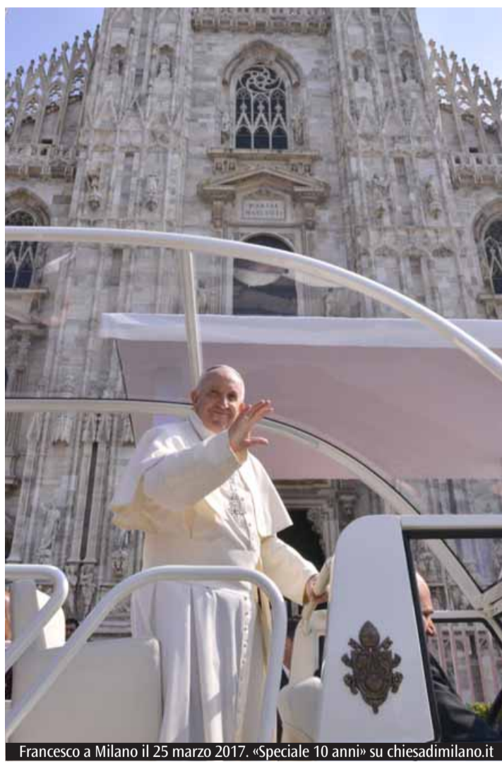
Francesco a Milano il 25 marzo 2017. «Speciale 10 anni» su chiesadimilano.it