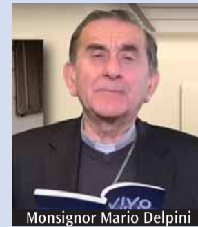
Monsignor Mario Delpini

Continua in Quaresima l'ormai tradizionale appuntamento quotidiano con un breve momento di preghiera proposto dall'arcivescovo di Milano, monsignor Mario Delpini. «Kyrie, Signore! In preghiera per la pace con l'arcivescovo, ogni giorno di Quaresima» sono il titolo e il sottotitolo della proposta che sarà possibile seguire già a partire dal mattino: dalle ore 6.40, infatti, la meditazione sarà disponibile sul portale diocesano www.chiesadimilano.it e sui social (e sarà poi ovviamente fruibile in qualunque momento della giornata).