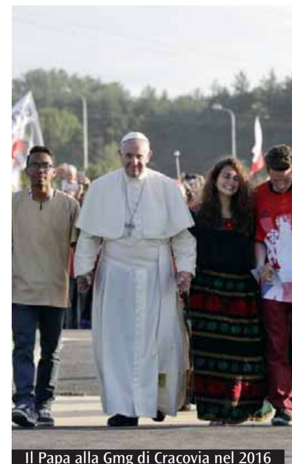
Il Papa alla Gmg di Cracovia nel 2016

In un messaggio per la Giornata missionaria mondiale, sulle orme di Paolo, li nomina «viandanti della fede». Chiamati ad «accogliere, ascoltare e abbracciare tutti. Ogni vita è amata dal Signore, ogni volto mostra il volto di Cristo, specialmente quello di chi è ferito dalla vita, di chi è solo, di chi fugge dalla guerra e dalla morte», ribadisce in un discorso ai giovani dell'Azione cattolica. Parole, incontri e gesti - per chiosare - che cambiano la vita, stravolgono l'esistenza, convertono il cuore. Scandendo percorsi umani e di fede, appena scontornati dagli anni. Dio si palesa anche in questi momenti, parla dentro questi incontri, palpita nell'attimo in cui il respiro si ferma, l'anima fremito e la bellezza irroro il mondo.