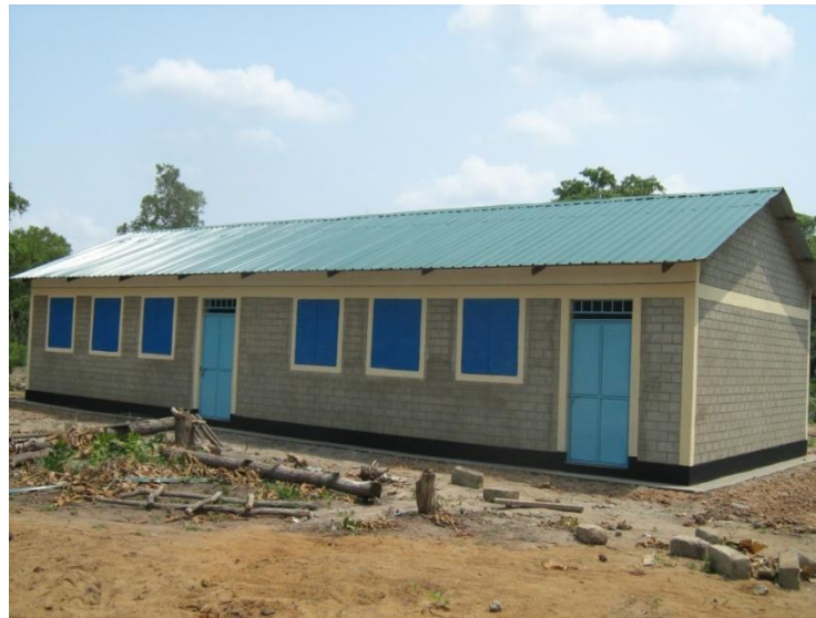
Classi costruite da noi ad aiutarli