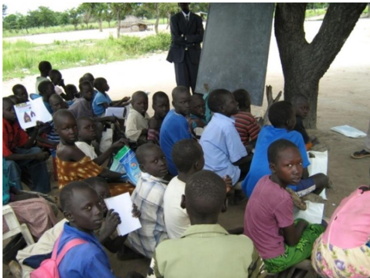
Classe sotto gli alberi