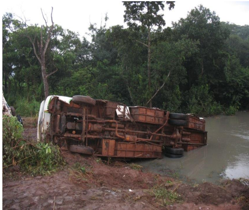
Rischio di vita