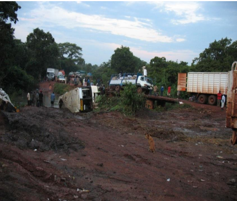
Notti passate nei boschi