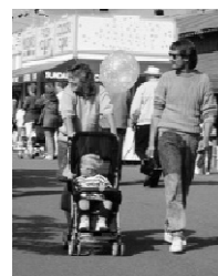
Servizio per la Famiglia