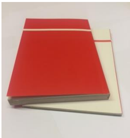
3/4 Diario Libro