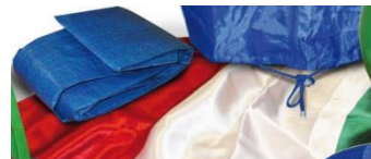
9/10 Telo Bandiera