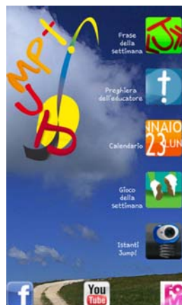
La schermata della App JUMP! per smartphone con sistema android

Questi giochi saranno a disposizione e da consultare anche sulla App JUMP!, pensata per gli animatori dallo smartphone «facile»! Si può scaricare la App dal Google play store cliccando sulla ricerca «Fondazione Oratori Milanesi» (solo per il sistema android).