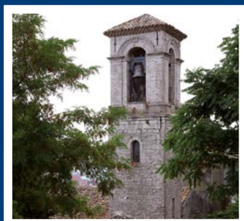
Ore 8.30 S. Messa del Patrono

Per i Parroci che hanno necessità di comandare il suono delle campane di più Chiese Parrocchiali di loro competenza: con il QUADRO COMANDO DE ANTONI oggi è possibile e facile! Basta un collegamento ad internet.