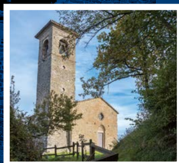
Ore 11.30 Celebrazione del Sacro Matrimonio