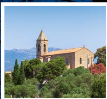
Ore 10.30 Liturgia Domenicale